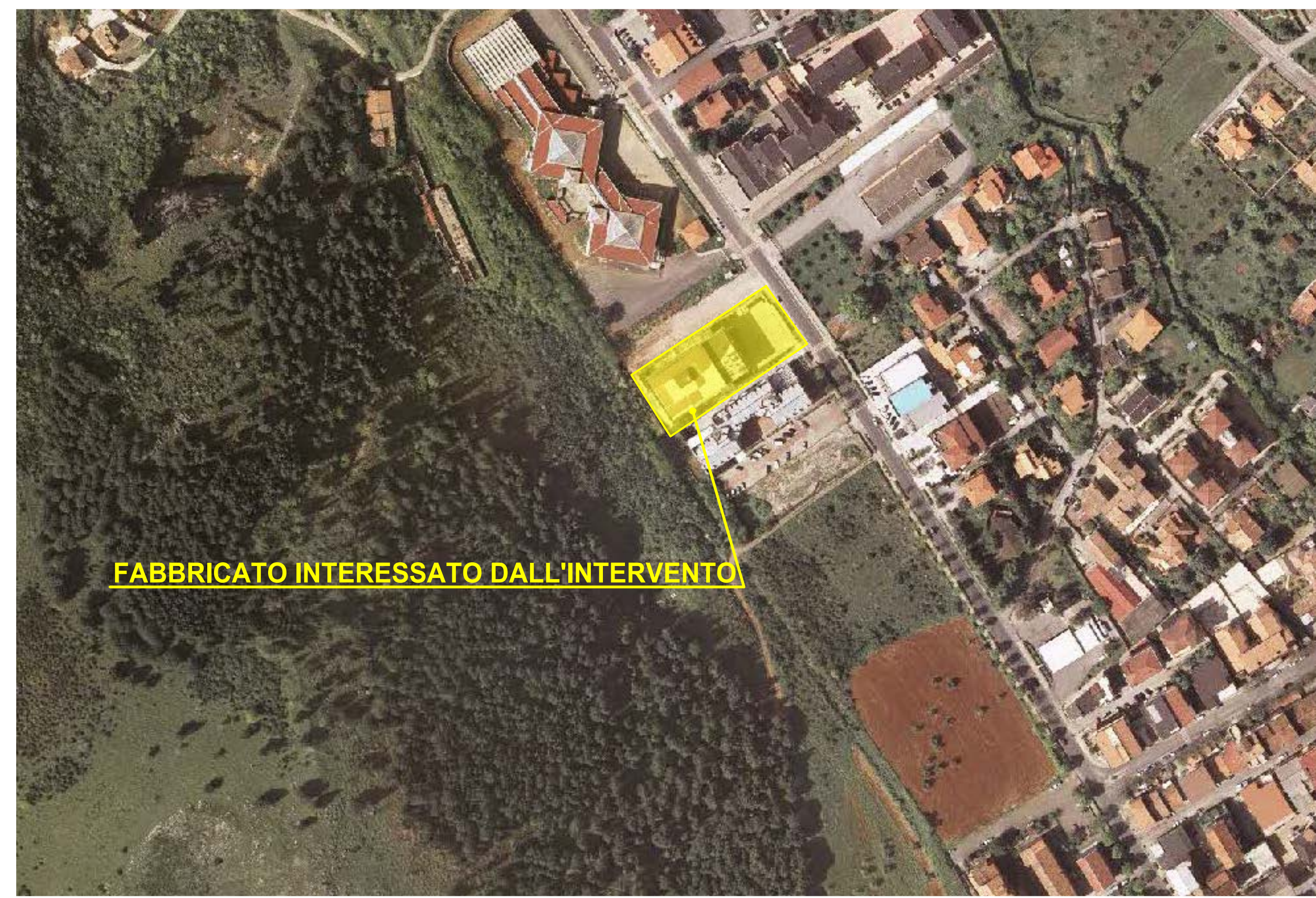
ORTOFOTO_ scala 1:2.000