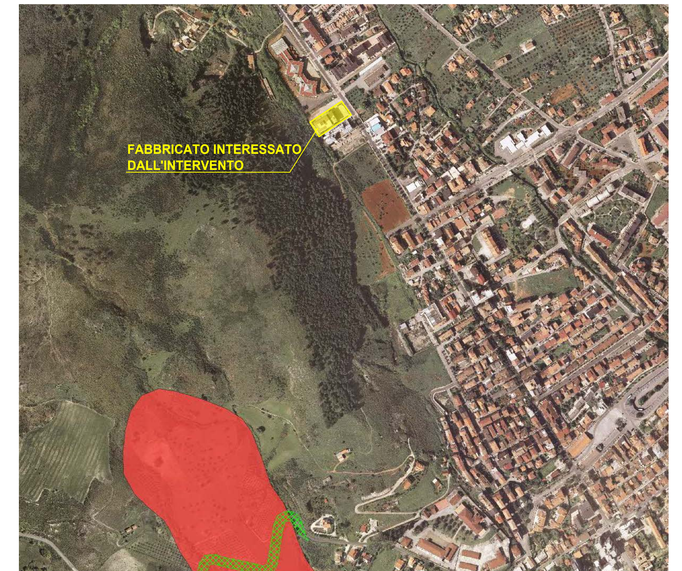
ESTRATTO PAL_ scala 1:10.000