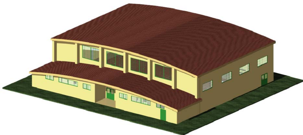
TAVOLA N° 13

COMPLETAMENTO PALESTRA ISTITUTO TECNICO PER GEOMETRI DI ROSSANO (CS)